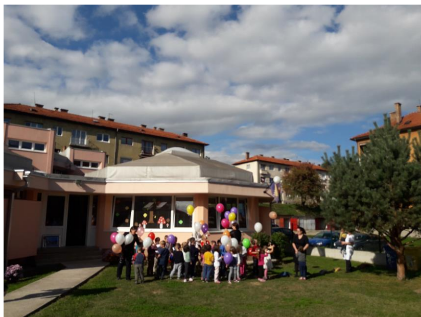
Нова детска площадка за Нови Травник, Босна и Херцеговина

На 17 март 2017 г. по проект „Помощ за развитие“ в центъра на град Олово бе открита „Българска чешма“.