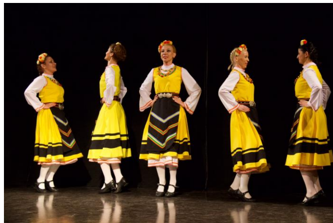
Откриване на обновения Културен дом в Източно Ново Сараево, Босна и Херцеговина

През 2016 г. е ремонтиран Културния център на община Източно Ново Сараево. Откриването на центъра се отпразнува с изпълнения на традиционна музика и колоритни народни танци.