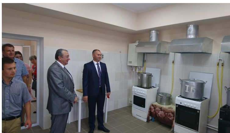
Обновен кухненски блок в детска градина в Кортен, Молдова

Основната цел на проекта беше подобряването на санитарните условия за приготвяне на храна на над 150 деца, посещаващи градината и включването към централния водопровод в селото. Така за децата в градината се осигури възможност да се радват на по-чиста и по-качествено приготвена храна.