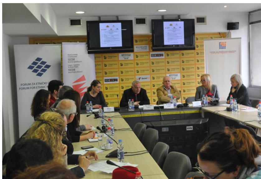
Програма за запознаване на СМИ на Сърбия с българската помощ за евроинтеграция на Сърбия

С българската помощ за развитие се реализира проект на сдружение „Група на либерални, амбициозни и солидарни“ – гражданска организация от Босилеград. Целта на проекта е да насърчи младите хора да вземат все по-активно участие в доброволни граждански проекти и инициативи. Проектът получи финансовата подкрепа на България в размер на 23 110 лв. Два семинара за младежи от Босилеград и региона бяха организирани в България и в Сърбия, на събитието беше предоставена широка публичност и участниците получиха чудесна възможност да се запознаят не само с възможностите за младежка мобилност в Европа, но и да придобият лидерски и организационни умения.