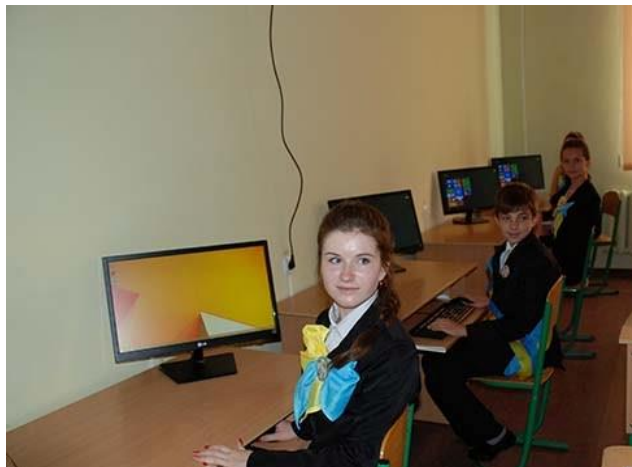
Кабинет по езиково обучение в Болград, Украйна

През 2017 г. в Украйна бяха подписани нови споразумения за предоставяне на безвъзмездна финансова помощ на Львовския национален университет, Киевския национален университет, Приморския регионален украинско-български лицей и Городненското училище. По проекта се закупи техника за интерактивно езиково обучение, подобно на кабинета, оборудван в Болградската гимназия.